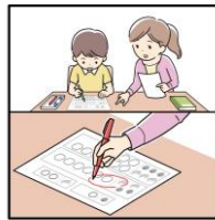
《Step2》 採点をして、できていないところだけを保護者と復習

「年長ペーパー総合クラス」の授業と同じカリキュラム内容を、講師の丁寧な解説動画を通して、ご家庭で何度でも繰り返し学習を進めることができます。映像授業で合理的かつ効率的に理解を深め、家庭学習の質をあげていきましょう。